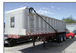
Remorque FABREX 1999, aluminium 26', "rack" à toile, inspectée, très bonne condition P.S.D.