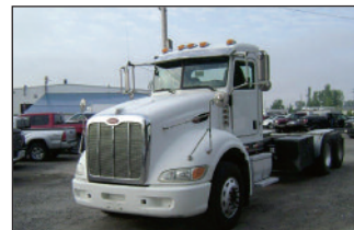
PETERBILT 386 2006, Cat refait, 475 hp, 13 vit., essieux 14/46 3/4 "Lock", susp. à air, inspecté juillet 2018 P.S.D.