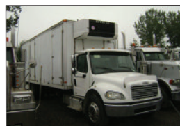
FREIGHTLINER M2-106 2012, Cummins 260 hp, 6 vit., 12/23, "Full Lock", boîte 26', très propre. P.S.D.