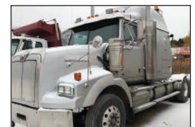
WESTERN STAR 4900 2012, DT15, 560 hp, 13 vitesses, essieux 14/46 "Full Lock", "Wet Kit" hydraulique P.S.D.