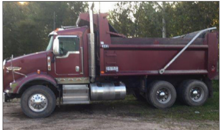
KENWORTH T800 2008, Cat C13, 410 hp, 8 LL, essieux 16/46, "Full Lock", susp. à air, attache, remorque arrière, boîte 15' P.S.D.