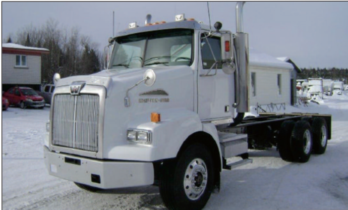
WESTERN STAR CNV 2006, moteur Cat C13 380 hp, 13 vitesses, 16/46 "Full Lock", suspension Airliner, CA 164", inspection SAAQ Déc 2018-01-12