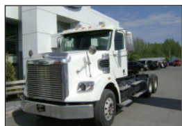
FREIGHTLINER Coronado 2011, DD15 560 hp, 18 vit., essieux 14.6/46, moteur refait, "Full Lock" P.S.D.