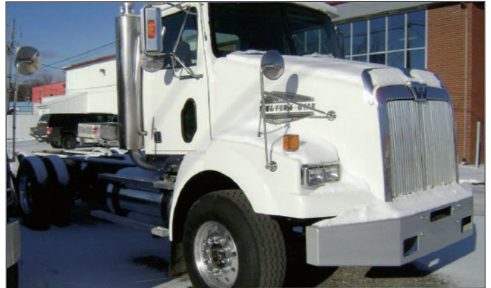
WESTERN STAR 2007, moteur Cat C13, 430 hp, 595,000 km, 13 vitesses, essieux 16/40 "Full Lock", suspension AirLiner, inspection SAAQ, neuve,