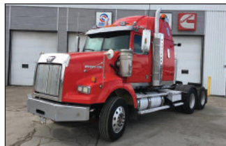
WESTERN STAR CNV 2009, Detroit 515 hp, 18 vit., 14/46, "Full Lock", "Wet Kit" hyd., SAAQ mars 2020, moteur refait P.S.D.