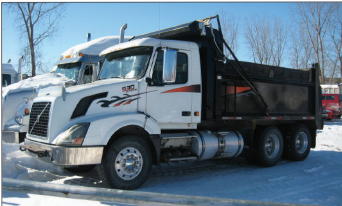
VOLVO CNV 2007, Cummins ISX 530 hp, 18 vitesses, essieux 16/46, "Full Lock", boîte 15' P.S.D.