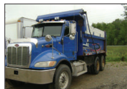
PETERBILT 340 2006, moteur Cat C7, 335 hp, 8 LL, essieux 16/40, "Full Lock", suspension à air P.S.D.