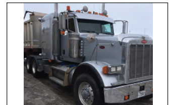
PETERBILT CNV 2005, Cat 550, 18 vit., essieux 20/46, "Full Lock", "Wet Kit" hydraulique P.S.D.