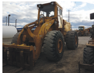
HOUGH 100 , Cummins, 1,000 h. A/R, fourche et godet $ 15 500

Chariot CAT 2005, 33 000 lb, en restauration P.S.D.