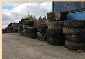
Vaste choix de pneus , 17.5X25 à 4565X45 P.S.D.