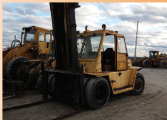
CAT , 20 000 lb, fourche 8', die- sel, prêt à travailler P.S.D.