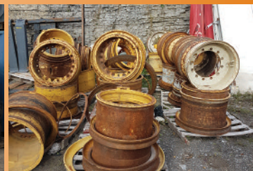
Vaste choix de jantes , 17.5, 20.5, 23.5, 26.5 et 29.5 P.S.D.

ENCAN 6 AVRIL 2019 : 284 ROUTE GRAVEL, NEUVILLE, QC, G0A 2R0