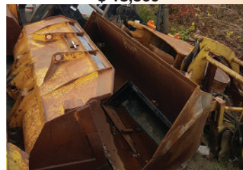
Godet et grappin à bois , fourches 4, 6, 7, et 8', capacité 5,000 à 60,000 lb