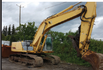
NEW HOLLAND 215 2007 , pla- nétaire neuf, prêt à travailler, att. rap. 2 godets, pouce $ 53,500