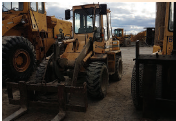
ZETTELMAYER 602 , att. rapide, fourche et godet $ 18,500