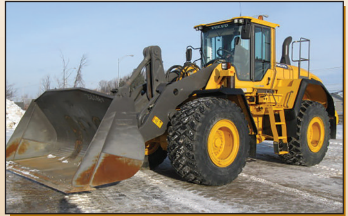
VOLVO L150G 2014 , 5,590 h, graissage auto., 3 e valve, attache rapide, godet standard