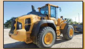
VOLVO L110H 2015 , 7,100 h., 3 e valve, attache rapide