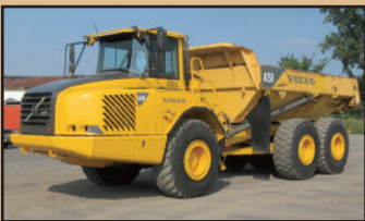
VOLVO A25D 2005 , 9,000 h,