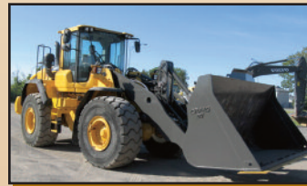
VOLVO L180G 2012 , A/C, 6,800 h. système de graissage auto.