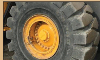
(4) Pneus TITAN 26.5X25, L5 LD250, comme neuf