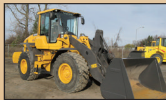
VOLVO L90G 2015 , 3,300 h., attache rapide, 3 e valve