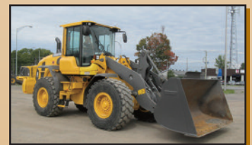
VOLVO L60G 2014 , 4,720 h., 3 e valve, attache rapide