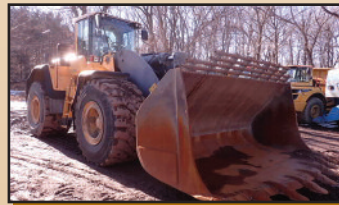
VOLVO L250G 2012 , 6,000 h., balance, système de graissage auto. godet 8 vc