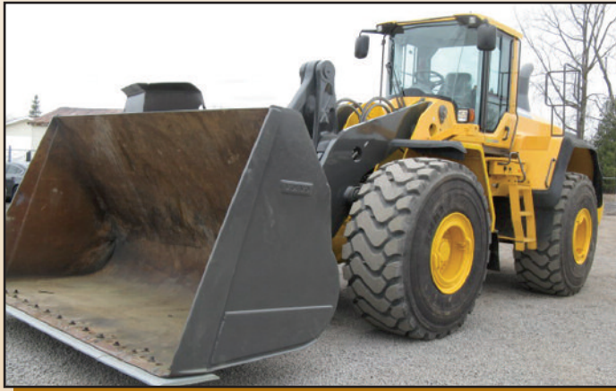
VOLVO L220H 2015 , 7,000 h., 3 e valve