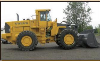
VOLVO L330E 2006 , 9,130 h., A/C, contrôle CDC, godet "Spade Nose",