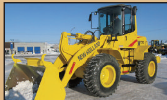
NEW HOLLAND LW130 2003 , 1,830 h, 3 e valve, attache rapide, godet 3 vc