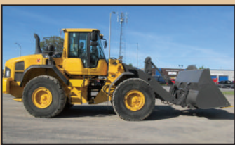
VOLVO L110G 2014 , 7,600 h., A/C, 3 e valve, attache rapide, système de graissage automatique